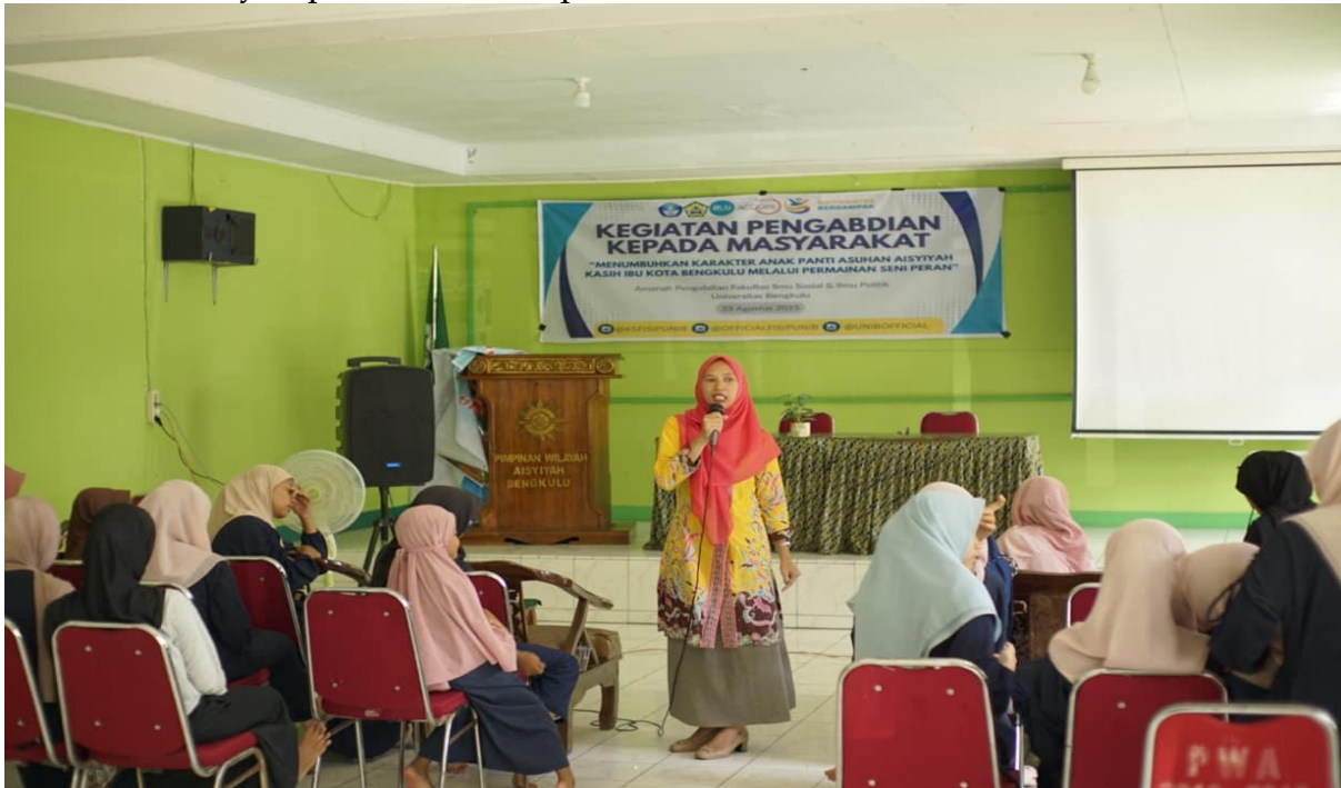
Gambar 2. Penyampaian Materi Kepada Anak Panti Asuhan