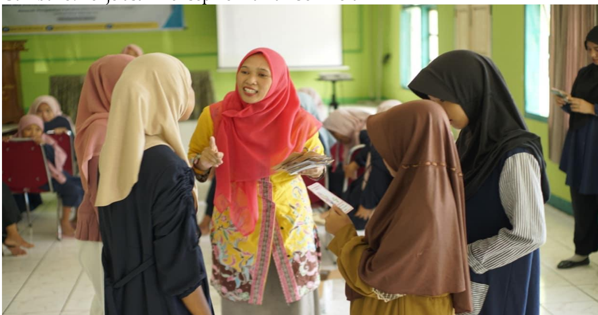
Gambar 3. Penjelasan Konsep Permainan Seni Peran

(Sumber: Dokumentasi Kegiatan Pengabdian Tahun 2025)